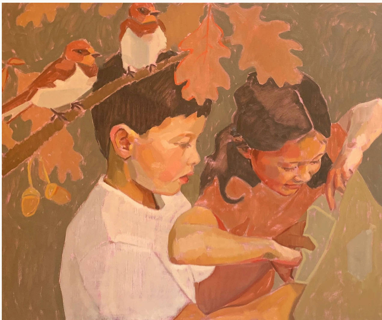
Treats, 2023 Huile sur toile 50 cm x 60 cm