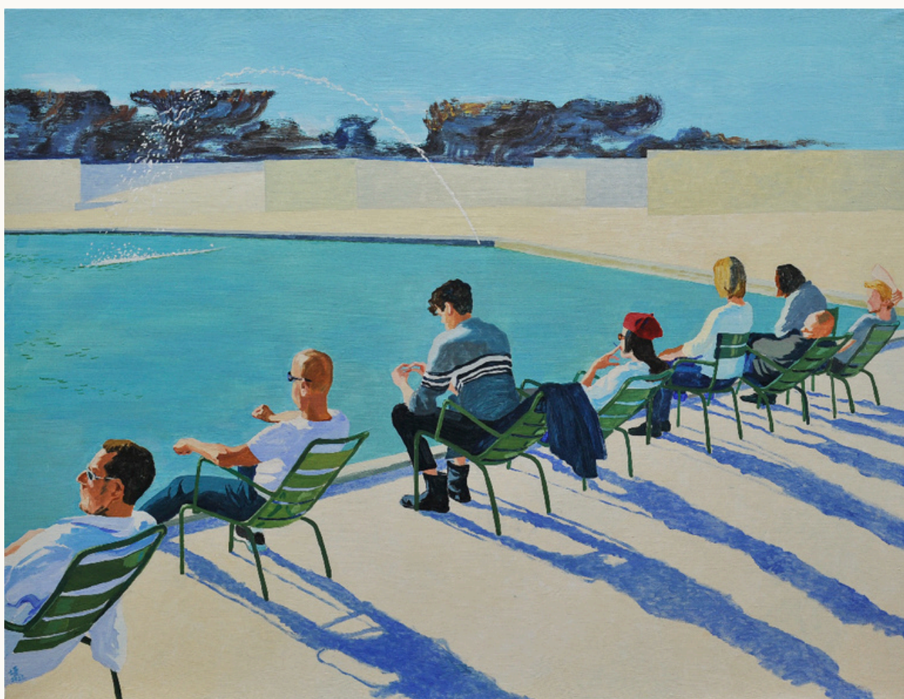
Fontain Park, 2022 Acrylique sur toile 89 cm x 116 cm