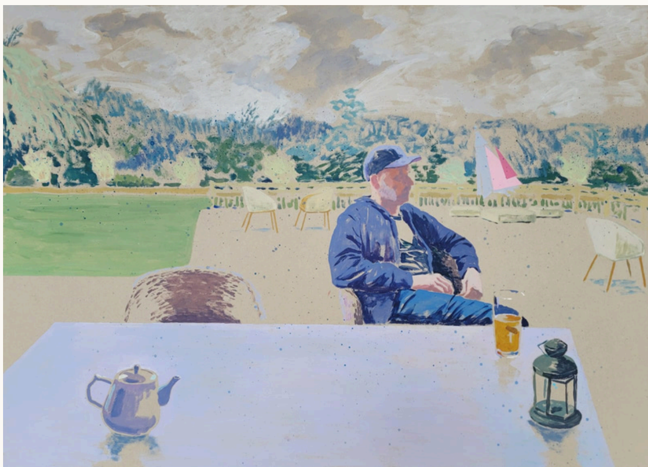
A cloudy day, 2023 Acrylique et collage sur carton 70 cm x 100 cm