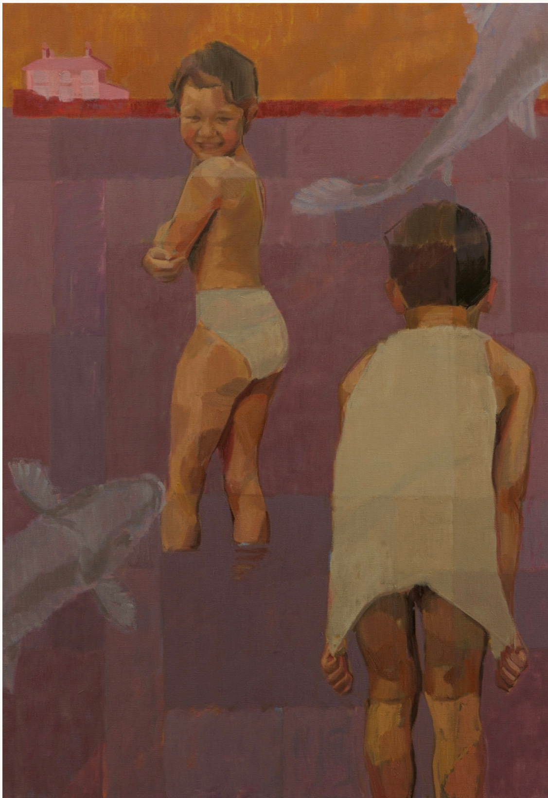
Seaside Scene, 2023